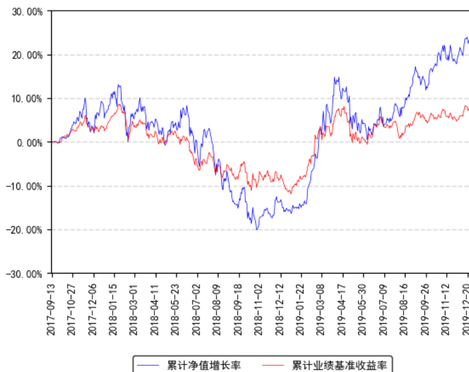
南方兴盛先锋灵活配置混合累计净值增长率与同期业绩比较基准收益率的历史走势对比图