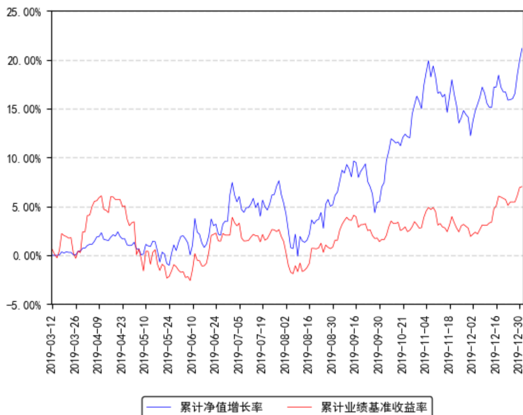
南方智诚混合累计净值增长率与同期业绩比较基准收益率的历史走势对比图

注：本基金合同于2019年3月12日生效，截至本报告期末基金成立未满一年；自基金成立日起6个月内为建仓期，建仓期结束时各项资产配置比例符合合同约定。