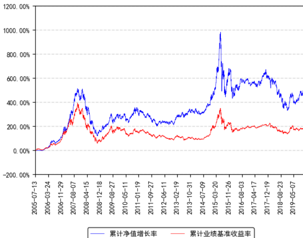
南方高增长混合(LOF)累计净值增长率与同期业绩比较基准收益率的历史走势对比图