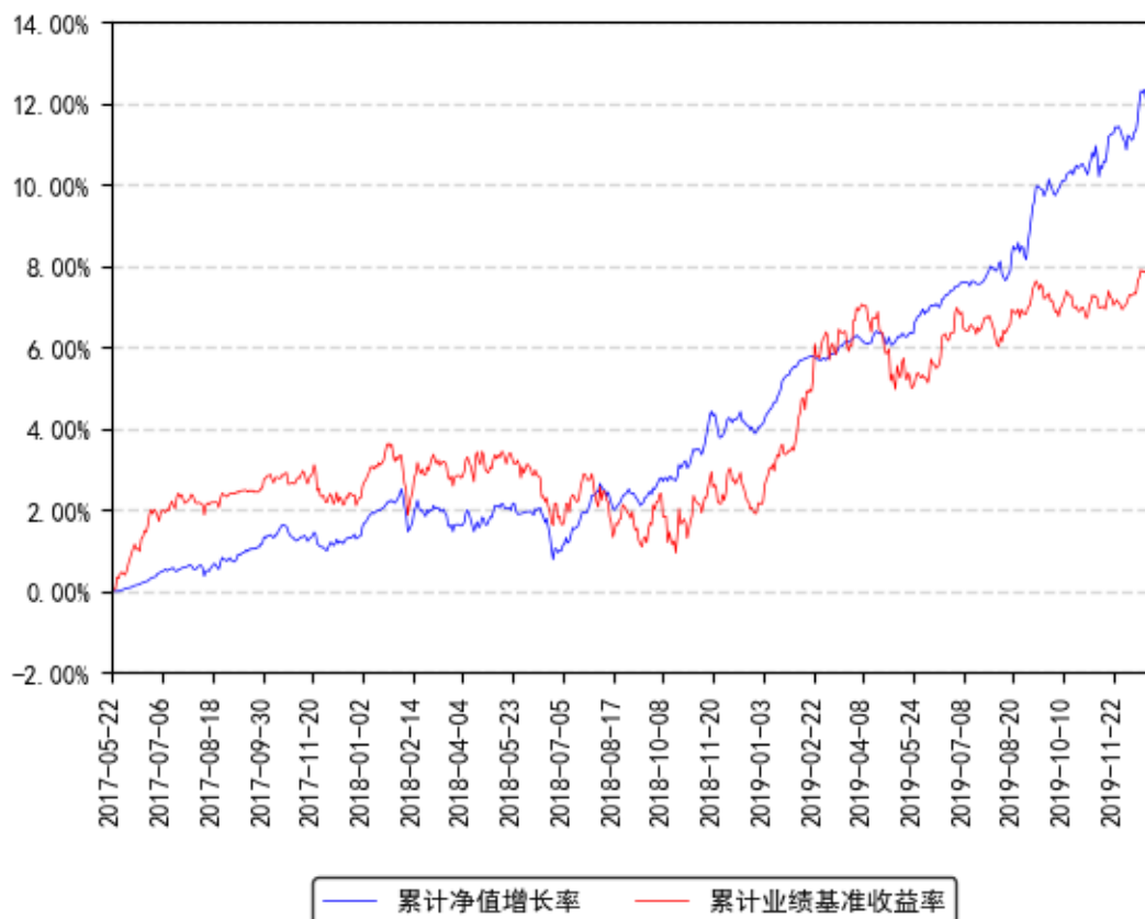
南方荣尊A累计净值增长率与同期业绩比较基准收益率的历史走势对比图