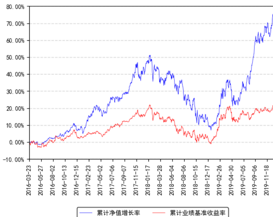
南方转型驱动灵活配置混合累计净值增长率与同期业绩比较基准收益率的历史走势对比图