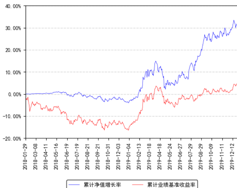
南方融尚再融资主题精选灵活配置混合累计净值增长率与同期业绩比较基准收益率的历史走势对比图