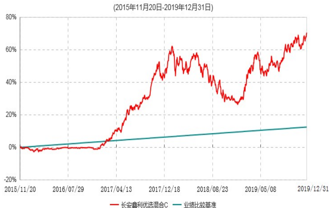
长安鑫利优选混合C累计净值增长率与业绩比较基准收益率历史走势对比图

长安鑫利优选混合 C 于 2015 年 11 月 17 日公告新增，实际首笔 C 类份额申购申请于 2015 年 11 月 20 日确认，图示日期为 2015 年 11 月 20 日至 2019 年 12 月 31 日。