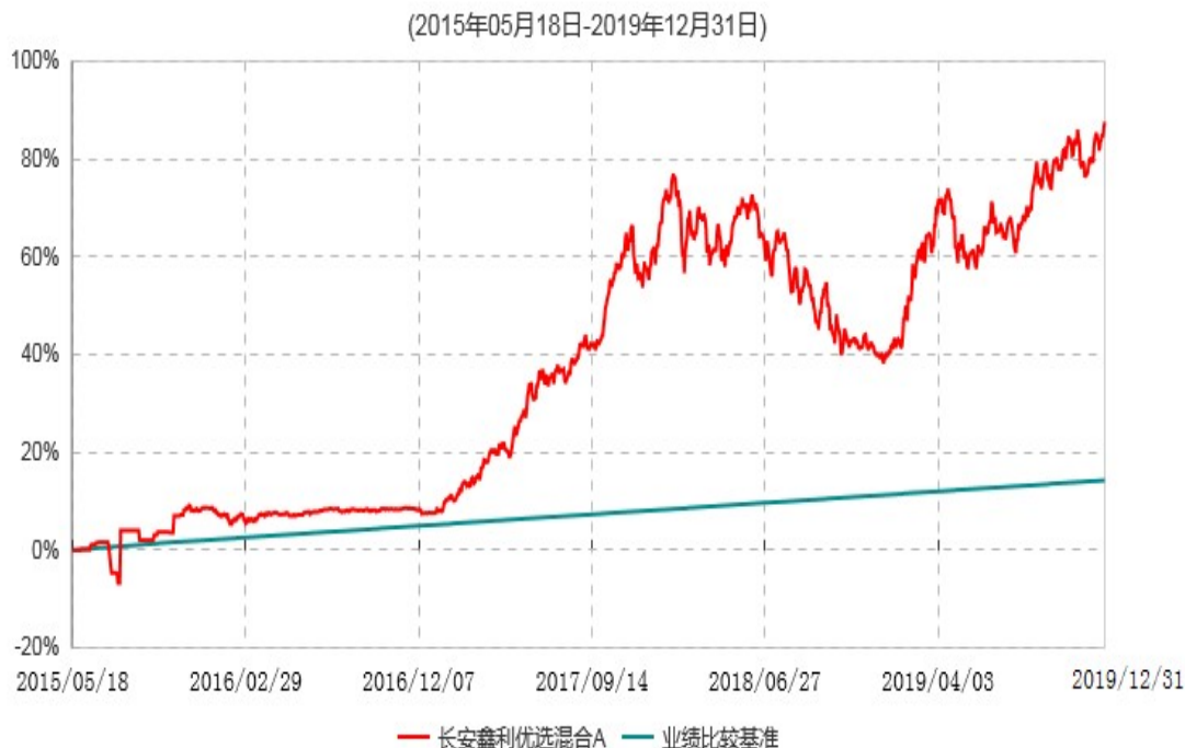
长安鑫利优选混合A累计净值增长率与业绩比较基准收益率历史走势对比图

本基金基金合同生效日为 2015 年 5 月 18 日，按基金合同规定，本基金自基金合同生效起 6 个月为建仓期，截止到建仓期结束时，本基金的各项投资组合比例已符合基金合同的相关规定。图示日期为 2015 年 5 月 18 日至 2019 年 12 月 31 日。