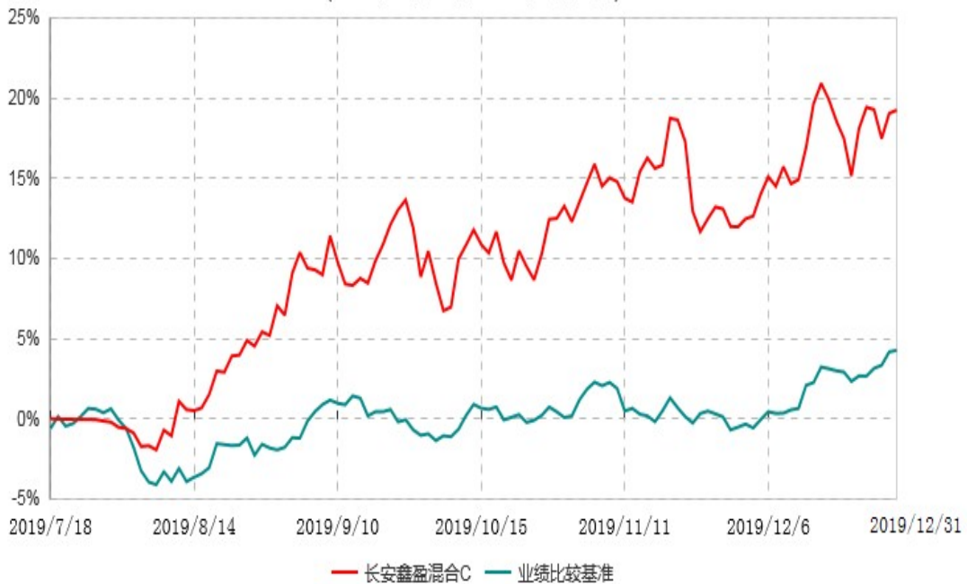
长安鑫盈混合C累计净值增长率与业绩比较基准收益率历史走势对比图 (2019年07月18日-2019年12月31日)

根据基金合同的规定,自基金合同生效之日起6个月内基金各项资产配置比例需符合基金合同要求。本基金于2019年7月18日成立,本基金仍在建仓期,图示日期为2019年7月18日至2019年12月31日。