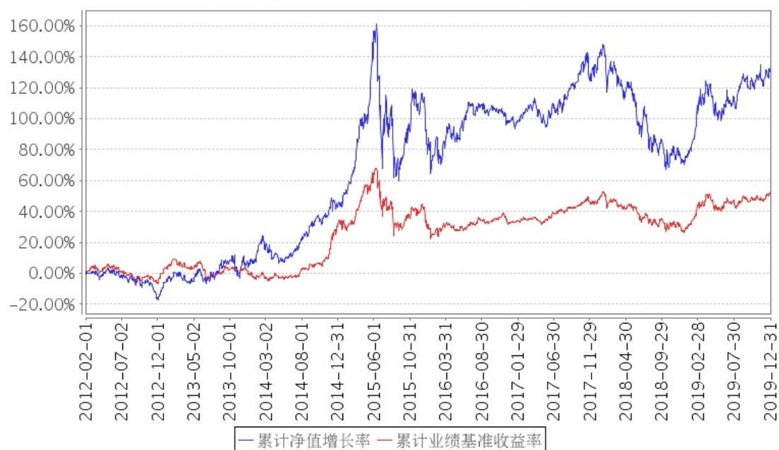
招商优势企业混合累计净值增长率与同期业绩比较基准收益率的历史走势对比图