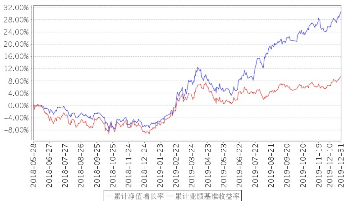
招商安博混合A累计净值增长率与同期业绩比较基准收益率的历史走势对比图