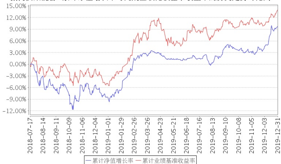
招商安荣混合A累计净值增长率与同期业绩比较基准收益率的历史走势对比图