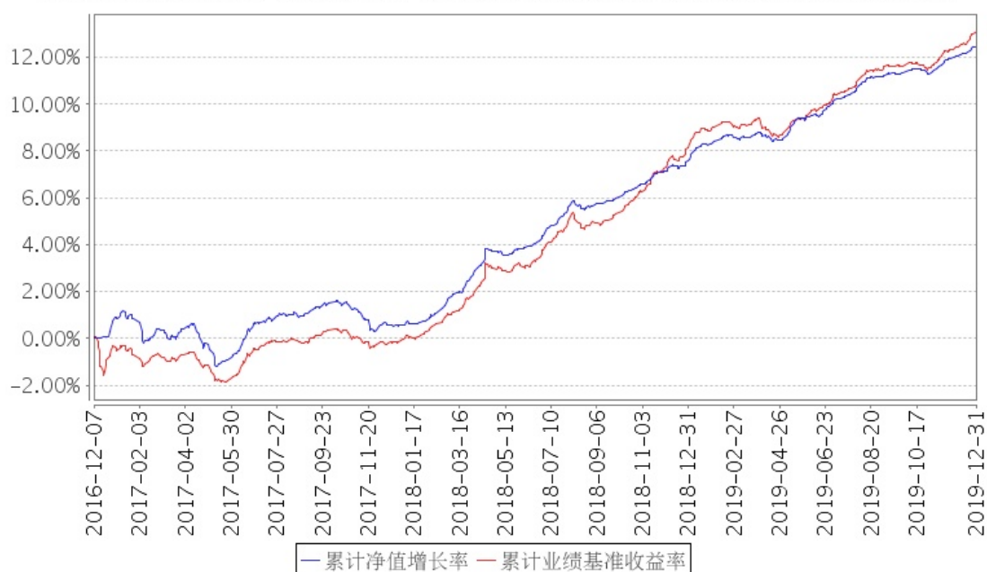
招商招祥纯债A累计净值增长率与同期业绩比较基准收益率的历史走势对比图