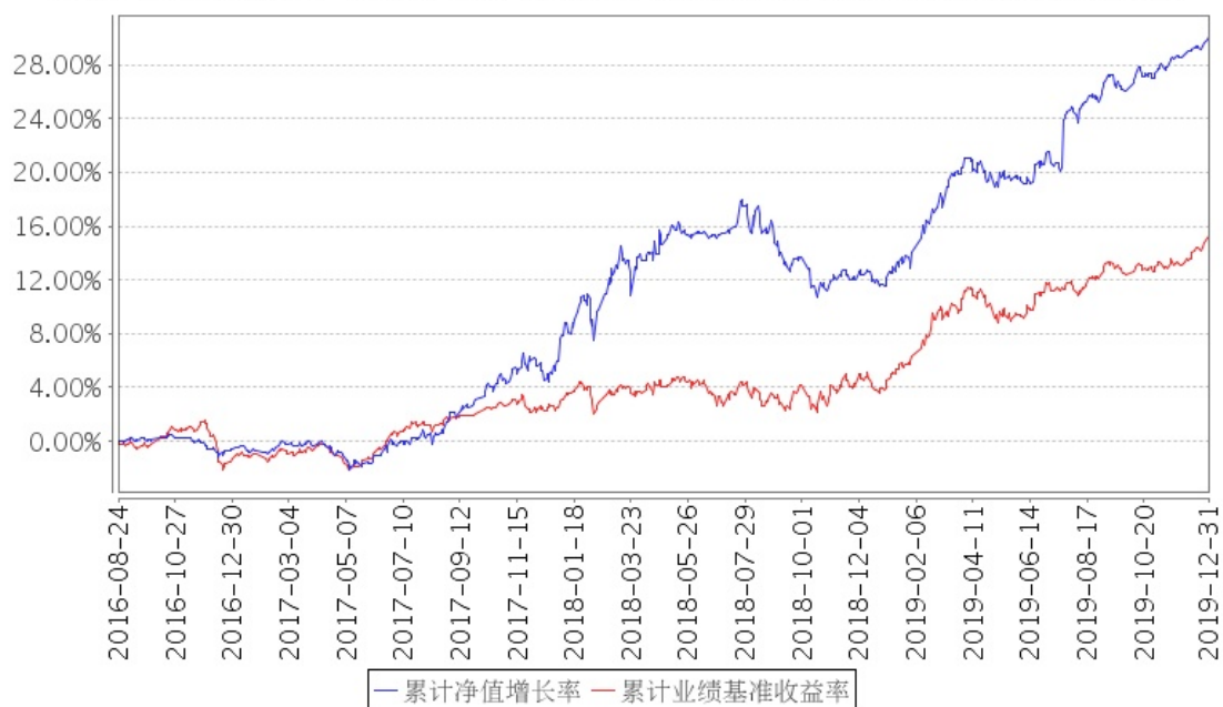
招商瑞庆混合A累计净值增长率与同期业绩比较基准收益率的历史走势对比图