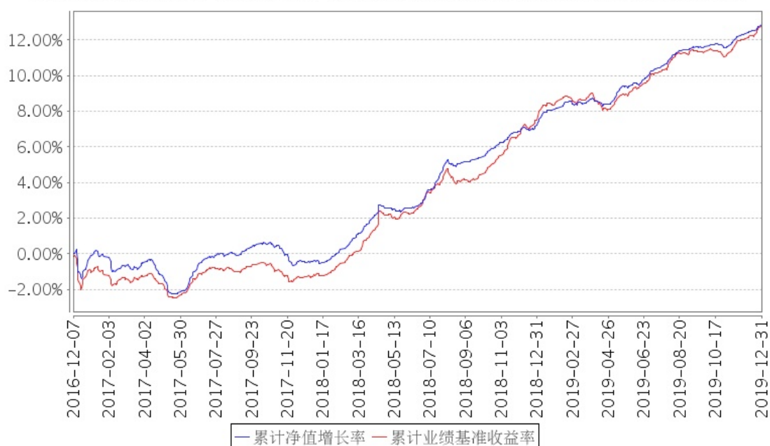
招商招顺纯债A累计净值增长率与同期业绩比较基准收益率的历史走势对比图