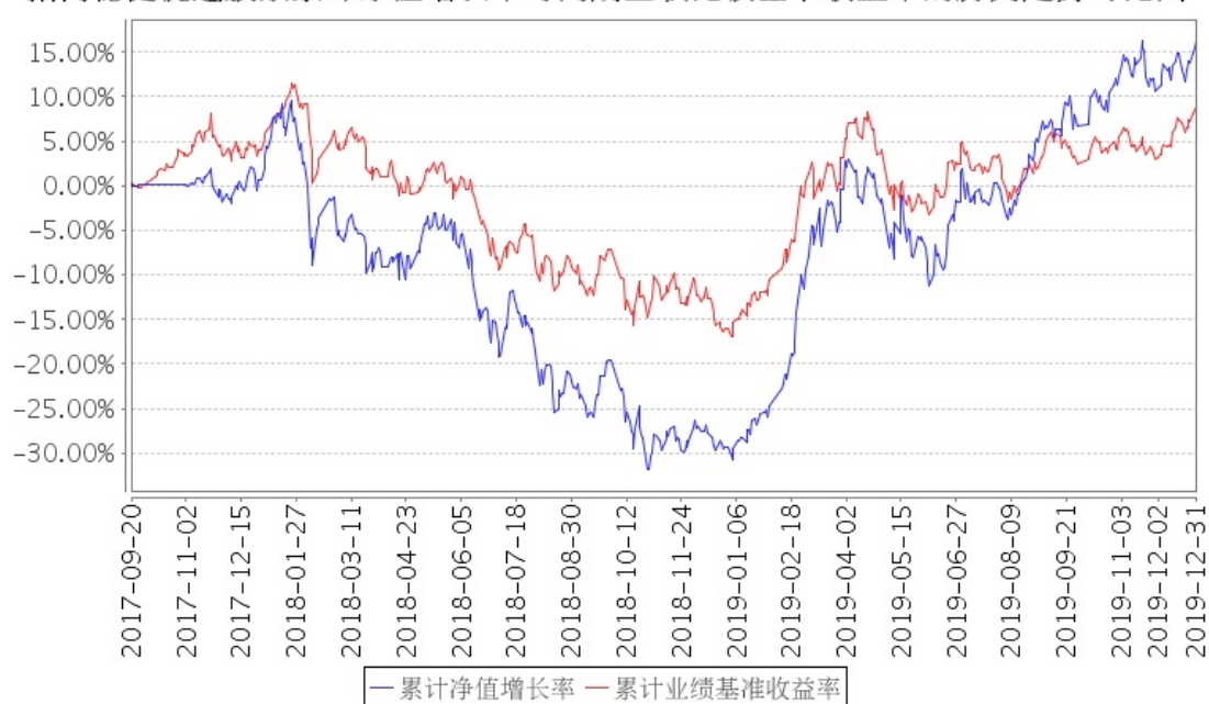
招商稳健优选股票累计净值增长率与同期业绩比较基准收益率的历史走势对比图