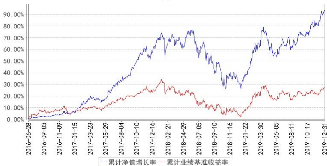
东方红睿满沪港深混合累计净值增长率与同期业绩比较基准收益率的历史走势对比图