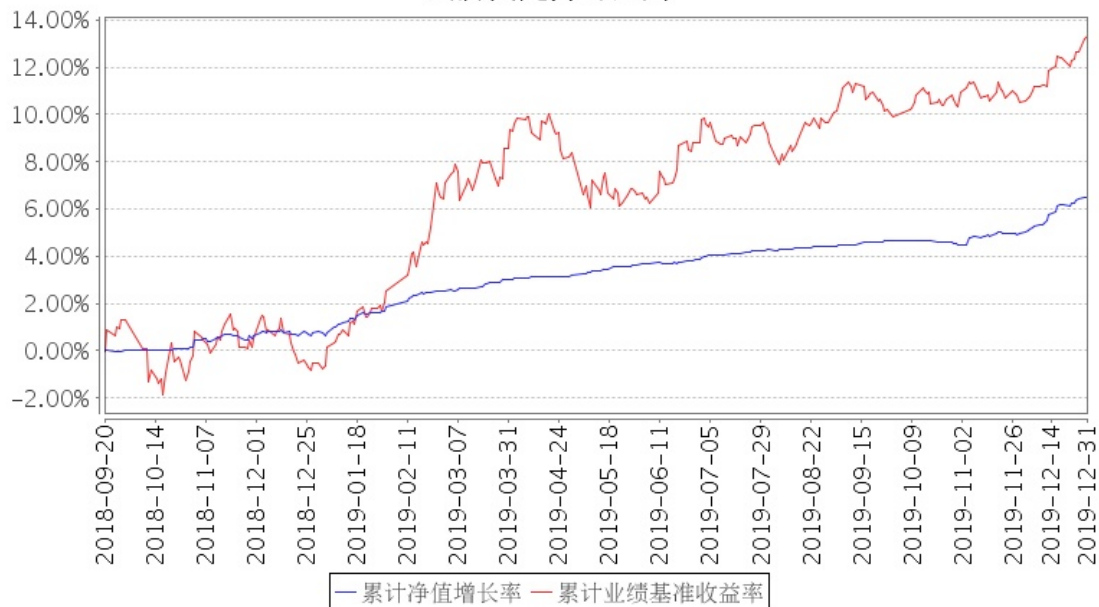
招商稳祺定期开放混合型证券投资基金累计净值增长率与同期业绩比较基准收益率的历史走势对比图