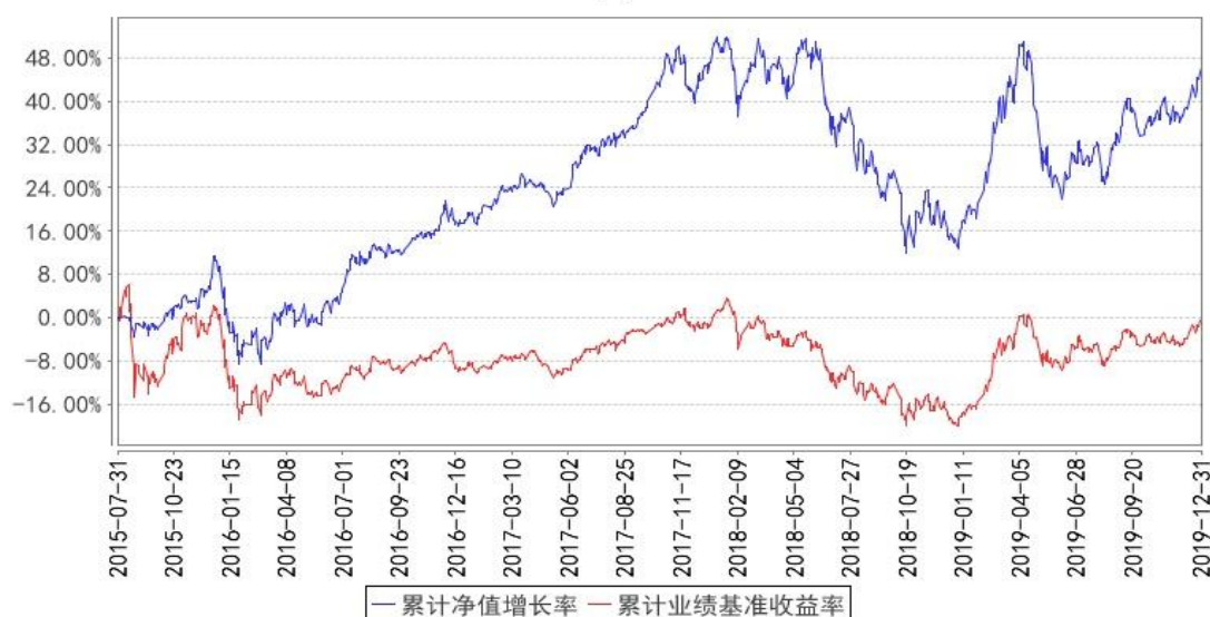
东方红京东大数据混合累计净值增长率与同期业绩比较基准收益率的历史走势对比图