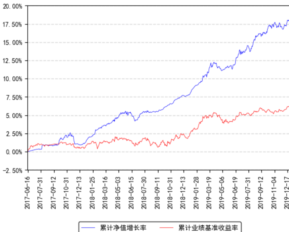
南方高元债券发起式A累计净值增长率与同期业绩比较基准收益率的历史走势对比图