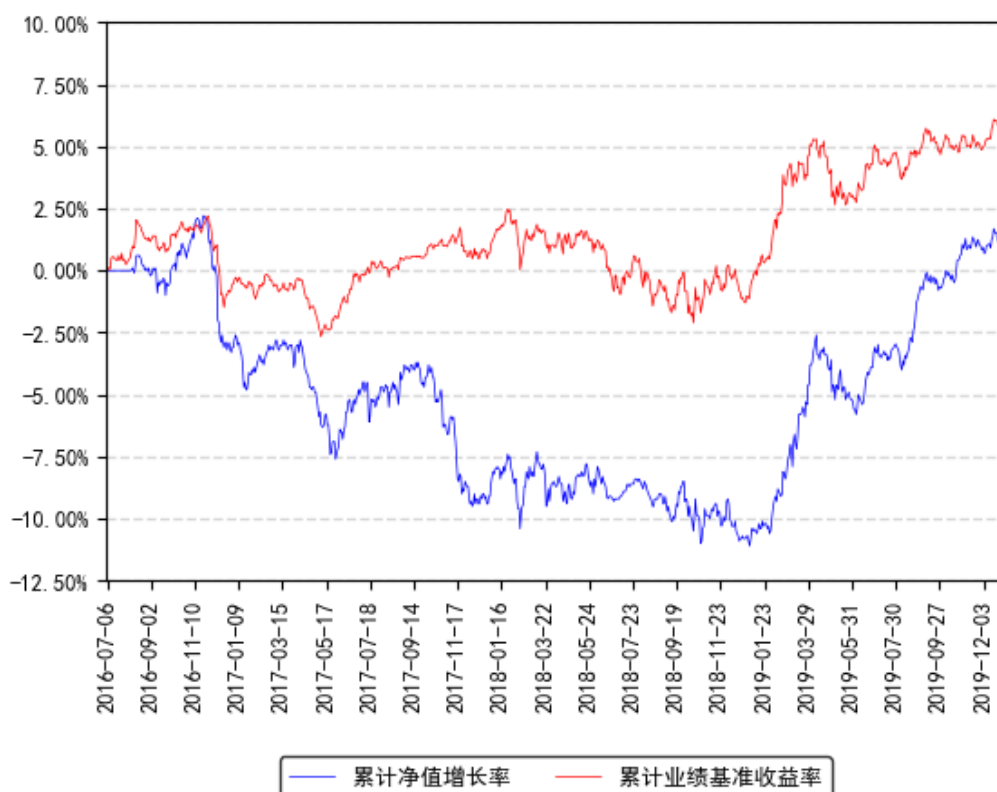
南方甄智混合发起累计净值增长率与同期业绩比较基准收益率的历史走势对比图

注：根据南方基金管理股份有限公司 2019 年 6 月 6 日发布的《南方甄智定期开放混合型发起式证券投资基金基金份额持有人大会表决结果暨决议生效的公告》，本基金于 2019 年 7 月 5 日由南方甄智定期开放混合型发起式证券投资基金变更为南方甄智混合型发起式证券投资基金，原基金的净值表现沿用。