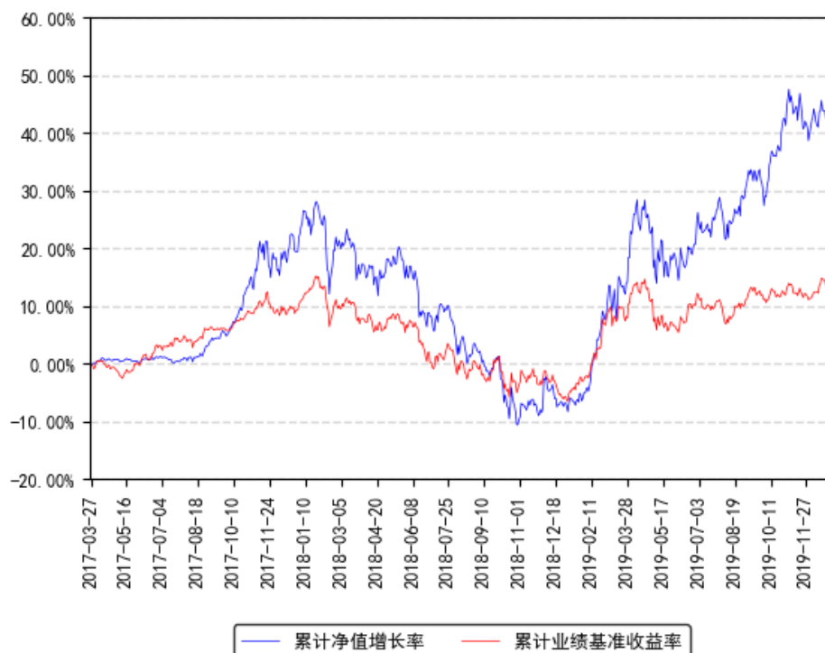
南方智慧精选灵活配置混合累计净值增长率与同期业绩比较基准收益率的历史走势对比图