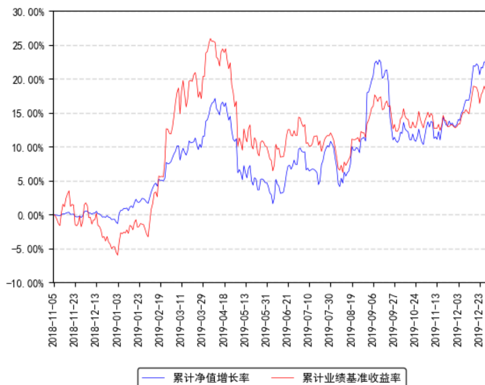
南方中小盘成长股票累计净值增长率与同期业绩比较基准收益率的历史走势对比图

注：本基金转型日期为2018年11月3日，本基金建仓期为6个月，建仓期结束时各项资产配置比例符合合同约定。