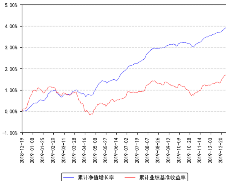
南方畅利定开债券发起累计净值增长率与同期业绩比较基准收益率的历史走势对比图