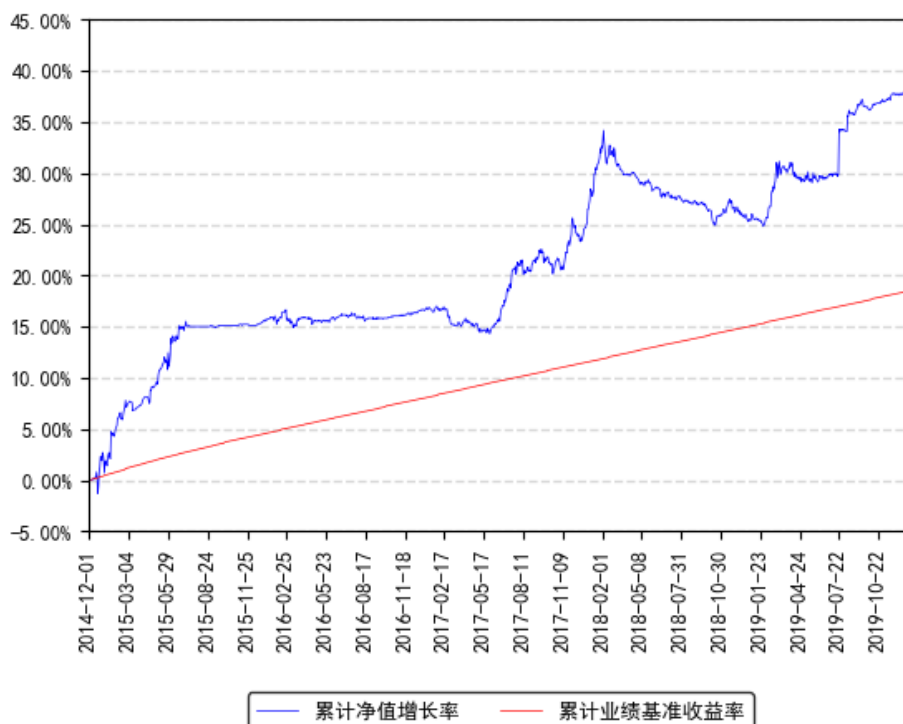
南方绝对收益策略定期混合累计净值增长率与同期业绩比较基准收益率的历史走势对比图