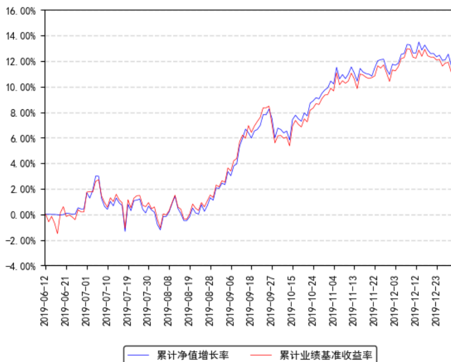
南方顶峰TOPIX ETF (QDII) 累计净值增长率与同期业绩比较基准收益率的历史走势对比图

注：本基金合同于 2019 年 6 月 12 日生效，截至本报告期末基金成立未满一年；本基金建仓期为自基金合同生效之日起 6 个月内，截至本报告期末建仓期未结束。