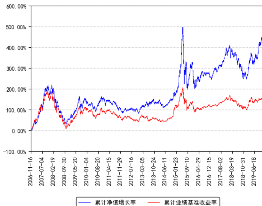
南方绩优成长混合A累计净值增长率与同期业绩比较基准收益率的历史走势对比图