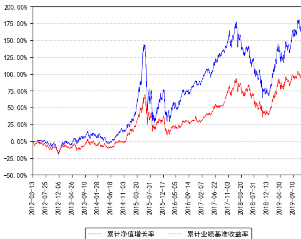
南方消费基础累计净值增长率与同期业绩比较基准收益率的历史走势对比图