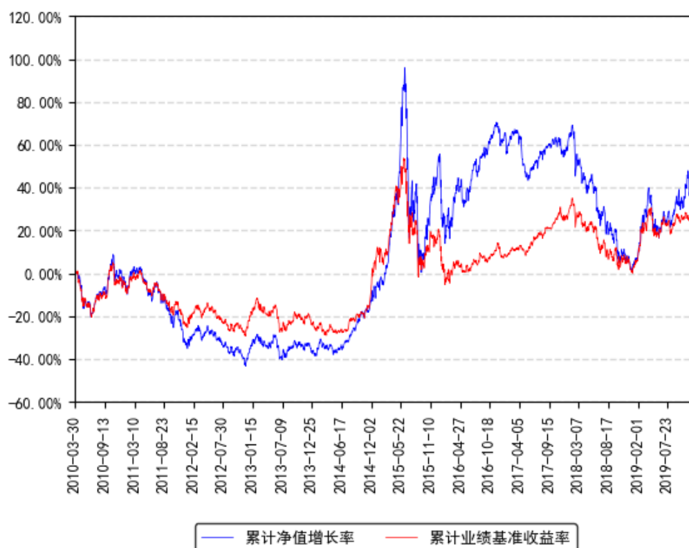
南方策略优化混合累计净值增长率与同期业绩比较基准收益率的历史走势对比图