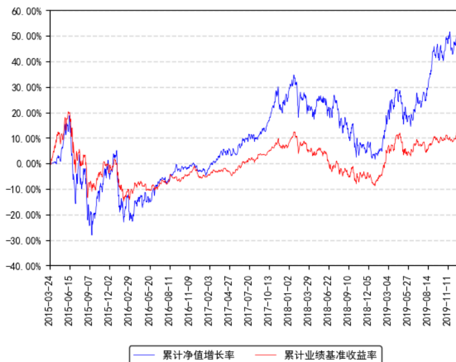
南方创新经济灵活配置混合累计净值增长率与同期业绩比较基准收益率的历史走势对比图