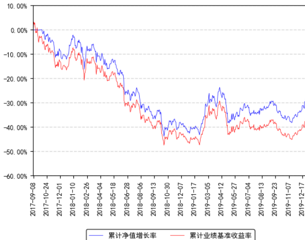
南方有色金属联接A累计净值增长率与同期业绩比较基准收益率的历史走势对比图