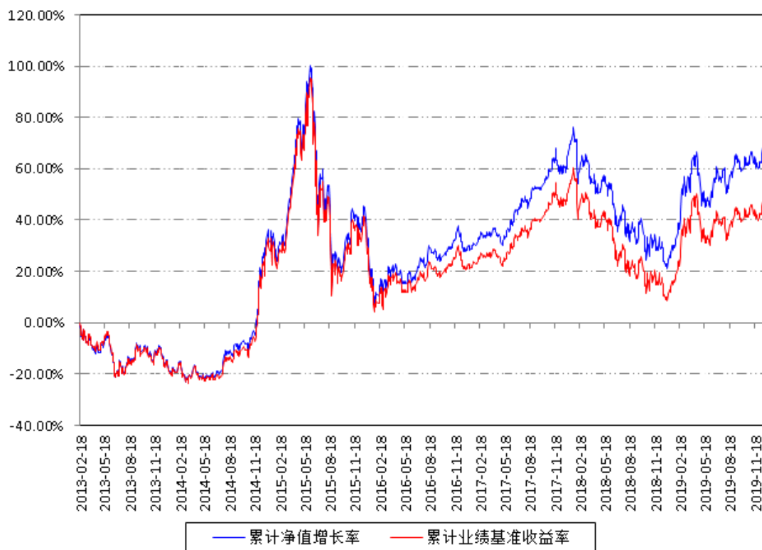
南方沪深300ETF累计净值增长率与同期业绩比较基准收益率的历史走势 对比图