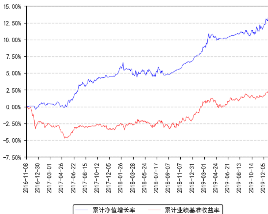
南方荣发定期开放混合发起式累计净值增长率与同期业绩比较基准收益率的历史走势对比图