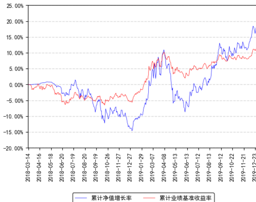
南方希元可转债债券累计净值增长率与同期业绩比较基准收益率的历史走势对比图