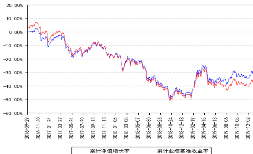
南方中证1000ETF累计净值增长率与同期业绩比较基准收益率的历史走势对比图