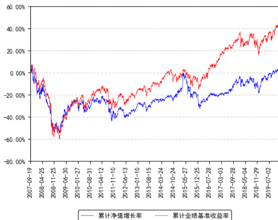
南方全球精选配置 (QDII-FOF) 累计净值增长率与同期业绩比较基准收益率的历史走势对比图