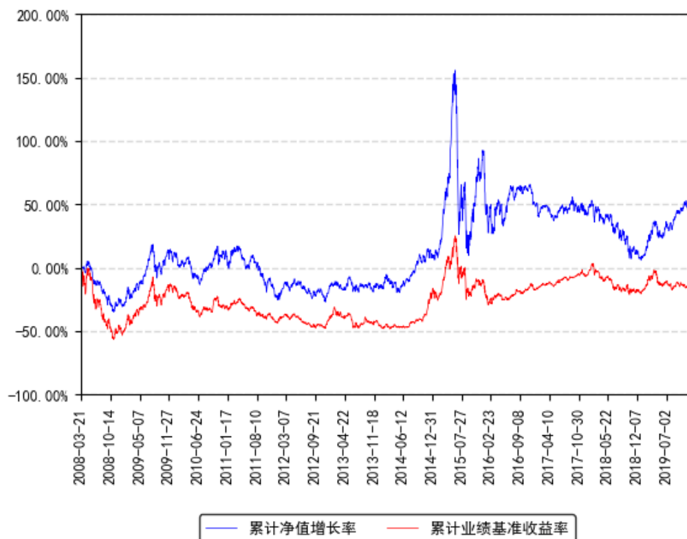
南方盛元红利混合累计净值增长率与同期业绩比较基准收益率的历史走势对比图