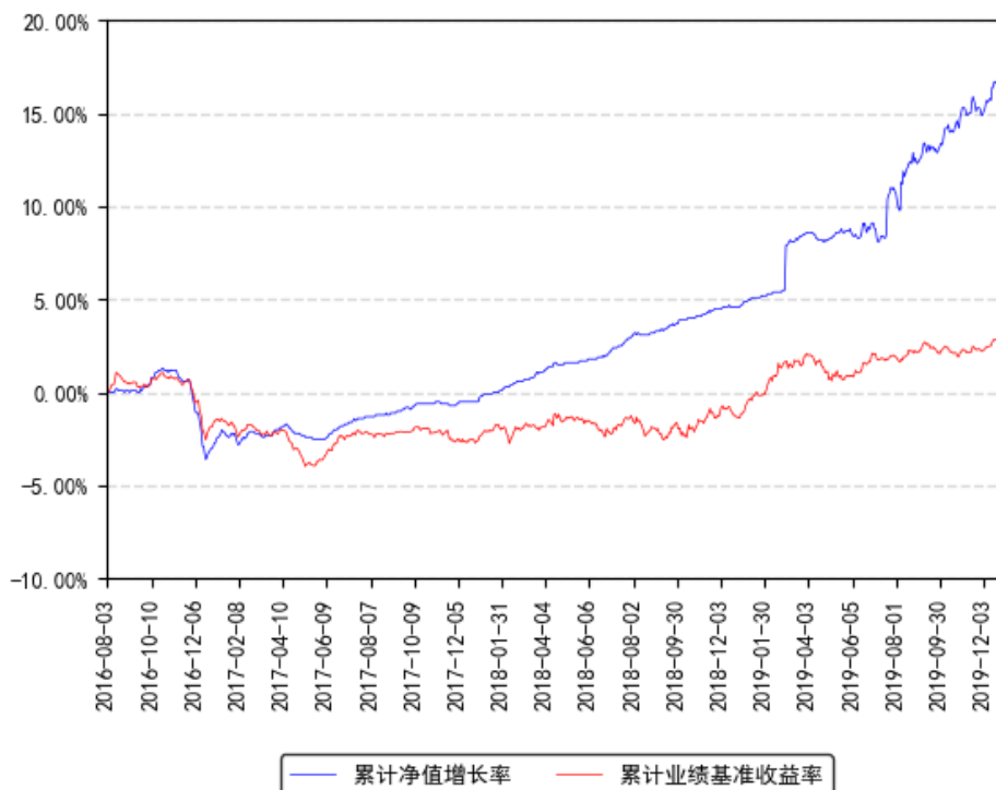
南方荣欢定期开放混合发起累计净值增长率与同期业绩比较基准收益率的历史走势对比图