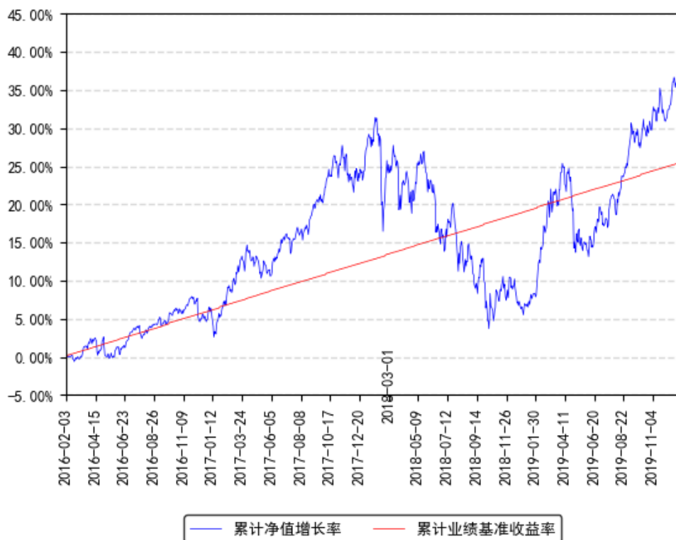
南方君选灵活配置混合累计净值增长率与同期业绩比较基准收益率的历史走势对比图