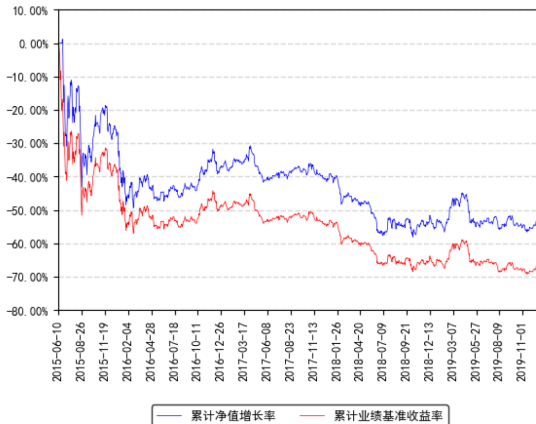
高铁基金累计净值增长率与同期业绩比较基准收益率的历史走势对比图