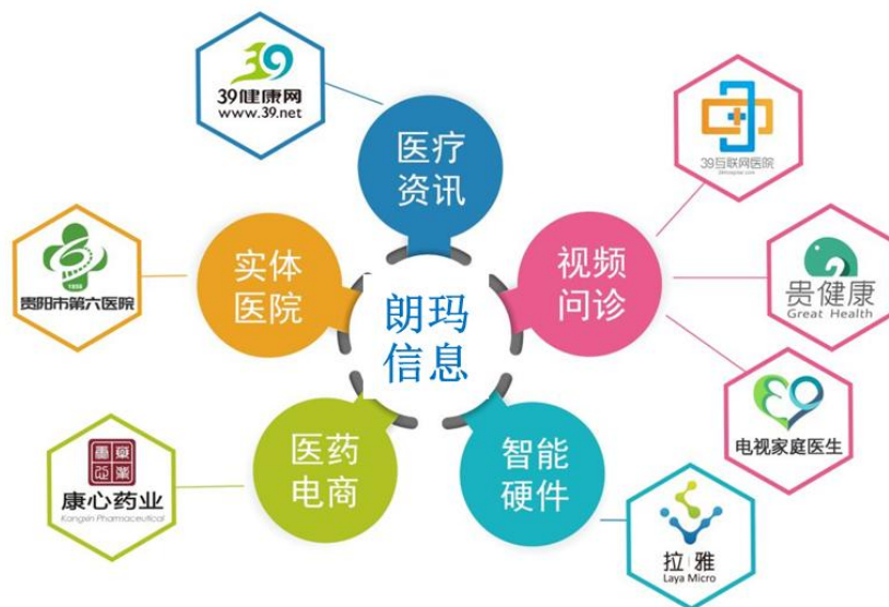
图：朗玛信息业务布局

公司“互联网+医疗”服务闭环以实体医疗机构贵阳六医为基础，以 39 健康网、39 互联网医院为代表，覆盖医疗健康信息服务、医疗服务、远程问诊、智能健康监测硬件、医药电商等业务板块。其中，由传统公立医院改制而来的贵阳六医坚持线上线下融合发展的发展思路，重点开展心血管、肿瘤、骨科等领域学科建设，医技、病房升级改造已基本完成，医疗服务质量及患者就医体验大幅提升；39 健康网专注于为用户提供优质的在线健康信息服务，内容包括医疗健康行业动态、医疗保健、疾病预防、疾病诊断、医学护理、医疗方案咨询、社区交流等，覆盖诊前、诊中、诊后全部医疗健康环节；39 互联网医院助力落实国家的分级诊疗政策，专注于为县市医院、民营医院提供智能、优质、规范的远程医疗服务和解决方案。