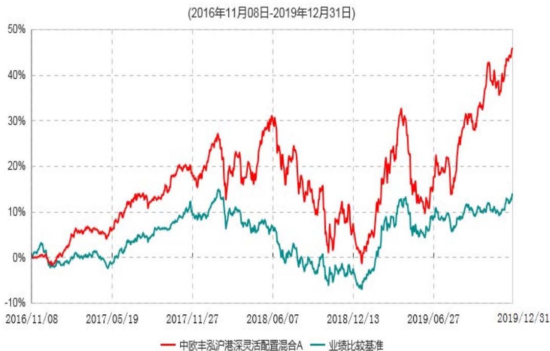
中欧丰泓沪港深灵活配置混合A累计净值增长率与业绩比较基准收益率历史走势对比图