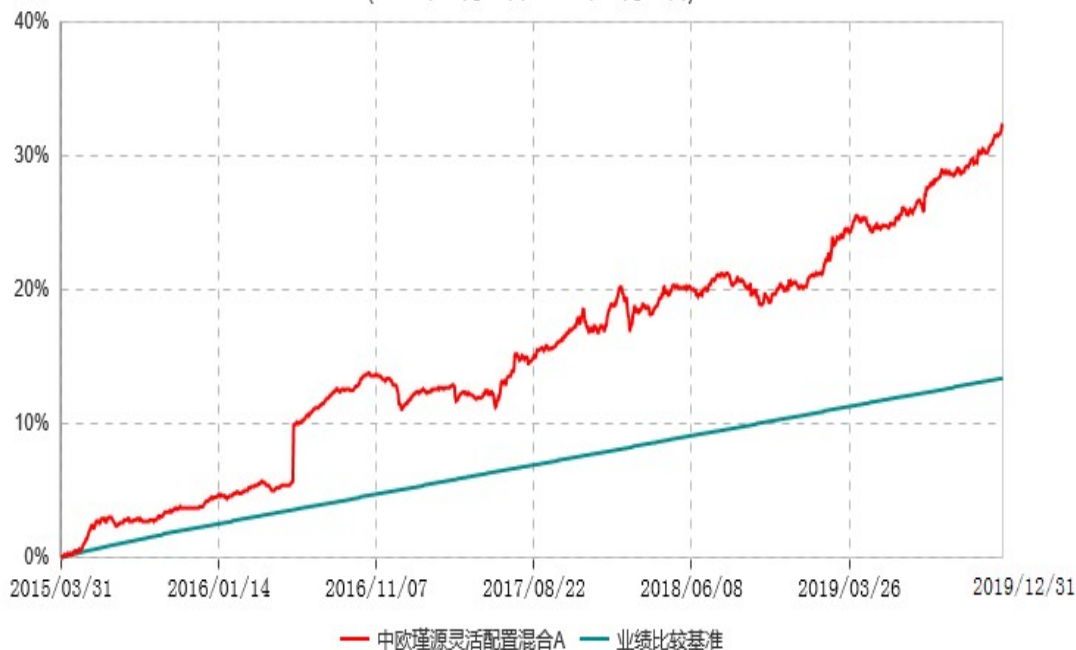
中欧瑾源灵活配置混合C累计净值增长率与业绩比较基准收益率历史走势对比图