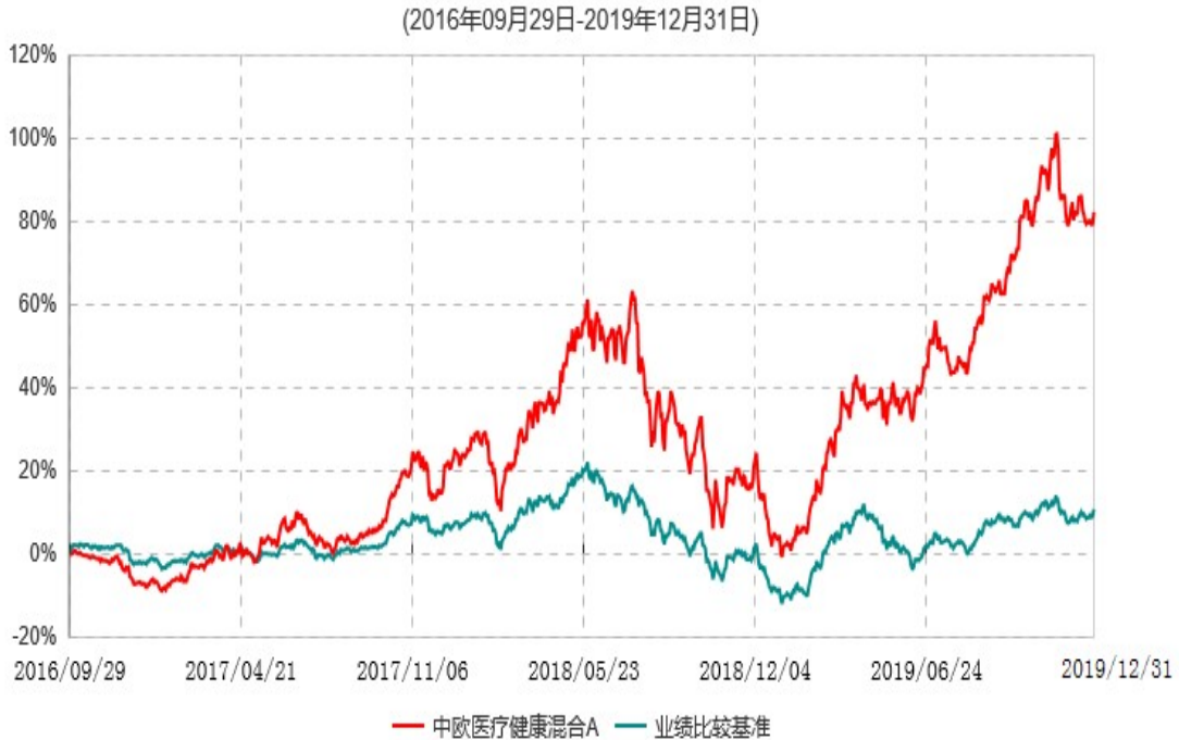
中欧医疗健康混合A累计净值增长率与业绩比较基准收益率历史走势对比图