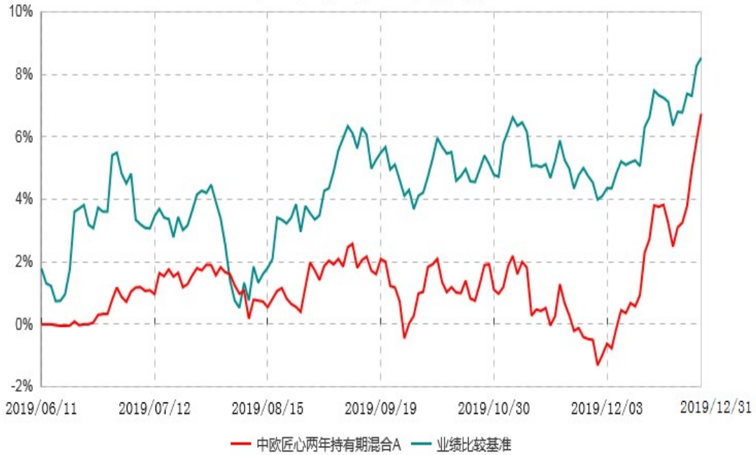
中欧匠心两年持有期混合A累计净值增长率与业绩比较基准收益率历史走势对比图 (2019年06月11日-2019年12月31日)

注：本基金基金合同生效日期为 2019 年 6 月 11 日，自基金合同生效日起到本报告期末不满一年，按基金合同的规定，本基金自基金合同生效起六个月为建仓期，建仓期结束时各项资产配置比例已符合基金合同约定。