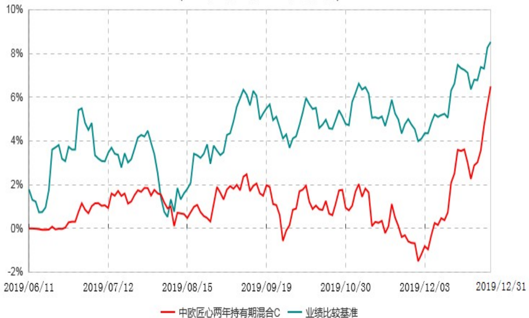
中欧匠心两年持有期混合C累计净值增长率与业绩比较基准收益率历史走势对比图 (2019年06月11日-2019年12月31日)

注：本基金基金合同生效日期为 2019 年 6 月 11 日，自基金合同生效日起到本报告期末不满一年，按基金合同的规定，本基金自基金合同生效起六个月为建仓期，建仓期结束时各项资产配置比例已符合基金合同约定。