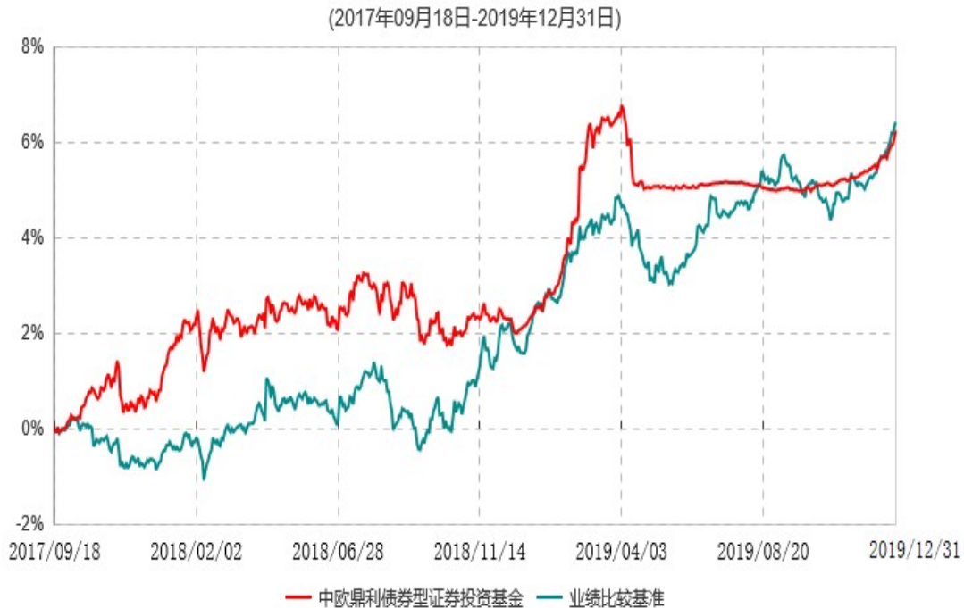
中欧鼎利债券型证券投资基金累计净值增长率与业绩比较基准收益率历史走势对比图

注：本基金转型生效日为2017年9月18日，图示日期为2017年9月18日至2019年12月31日。