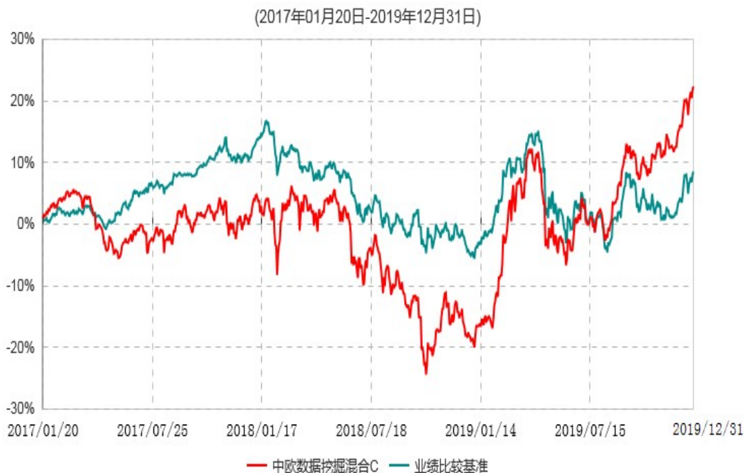
中欧数据挖掘混合C累计净值增长率与业绩比较基准收益率历史走势对比图

注: 自 2017 年 1 月 19 日起本基金增加 C 类份额, 图示日期为 2017 年 1 月 20 日至 2019 年 12 月 31 日。2019 年 4 月 26 日组合业绩比较基准变更为中证 500 指数收益率*95%+中债综合指数收益率*5%。