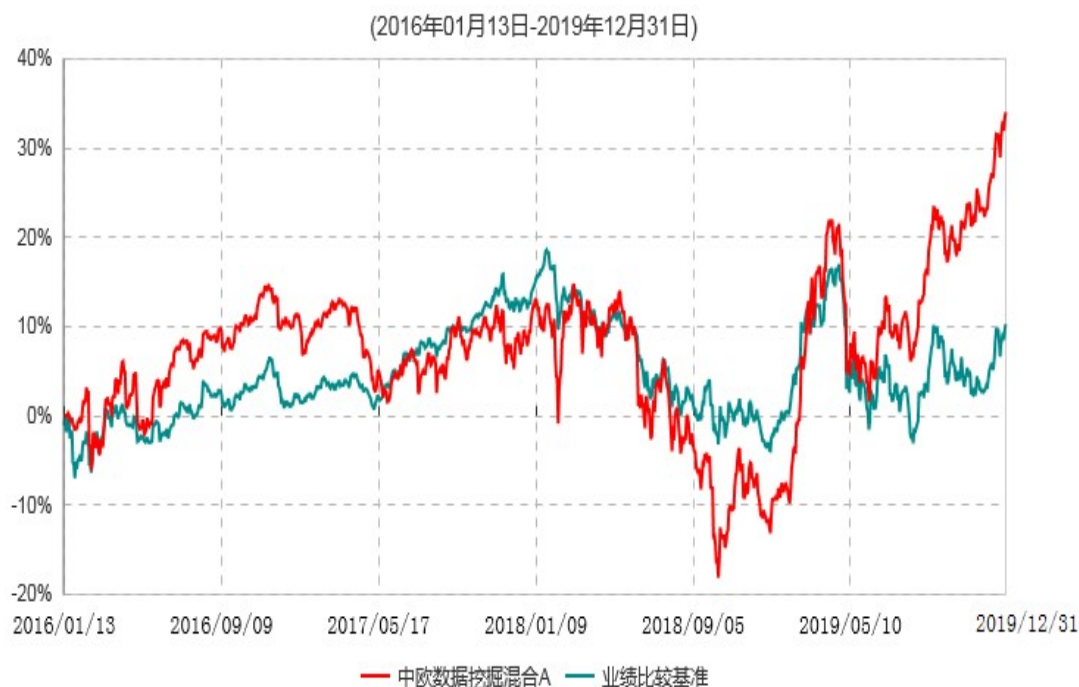
中欧数据挖掘混合A累计净值增长率与业绩比较基准收益率历史走势对比图

注：2019 年 4 月 26 日组合业绩比较基准变更为中证 500 指数收益率*95%+中债综合指数收益率*5%。