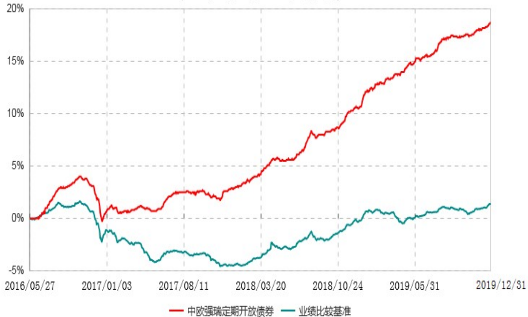
中欧强瑞多策略定期开放债券型证券投资基金累计净值增长率与业绩比较基准收益率历史走势对比图 (2016年05月27日-2019年12月31日)