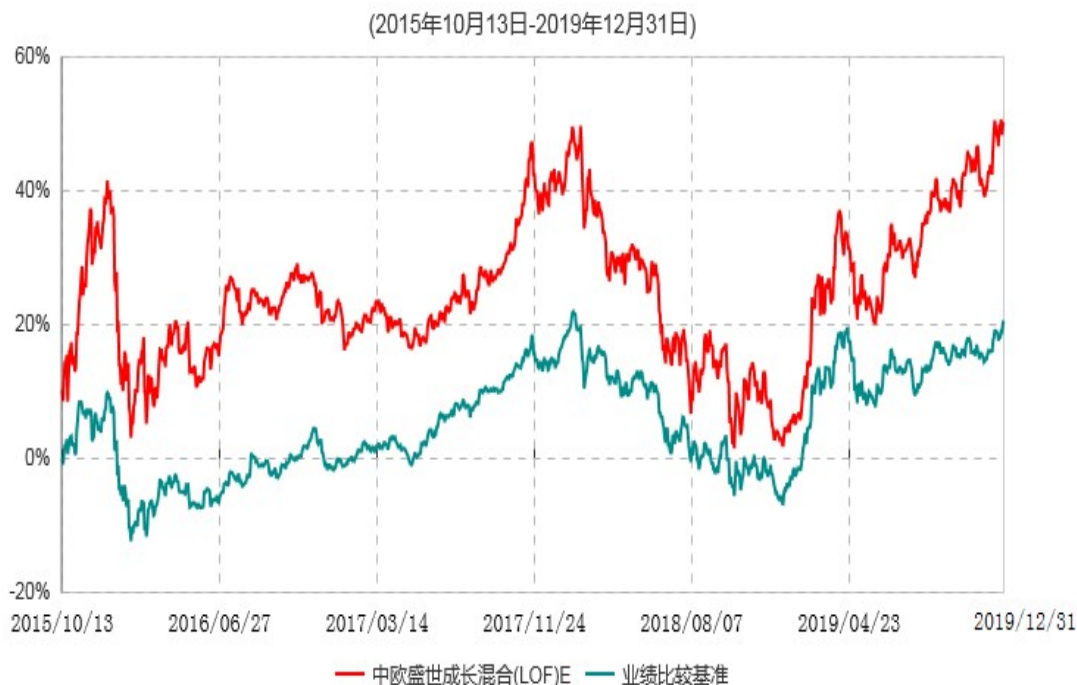
中欧盛世成长混合(LOF)E累计净值增长率与业绩比较基准收益率历史走势对比图

注本基金于 2015 年 10 月 8 日新增 E 份额，图示日期为 2015 年 10 月 13 日至 2019 年 12 月 31 日。