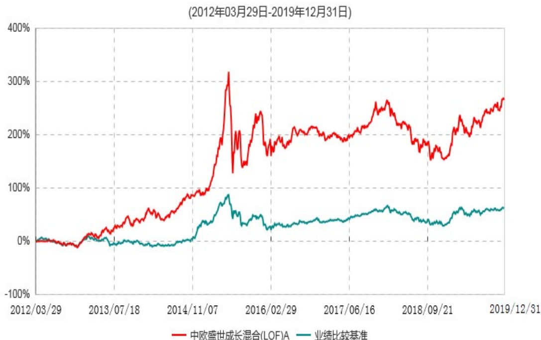
中欧盛世成长混合(LOF)A累计净值增长率与业绩比较基准收益率历史走势对比图