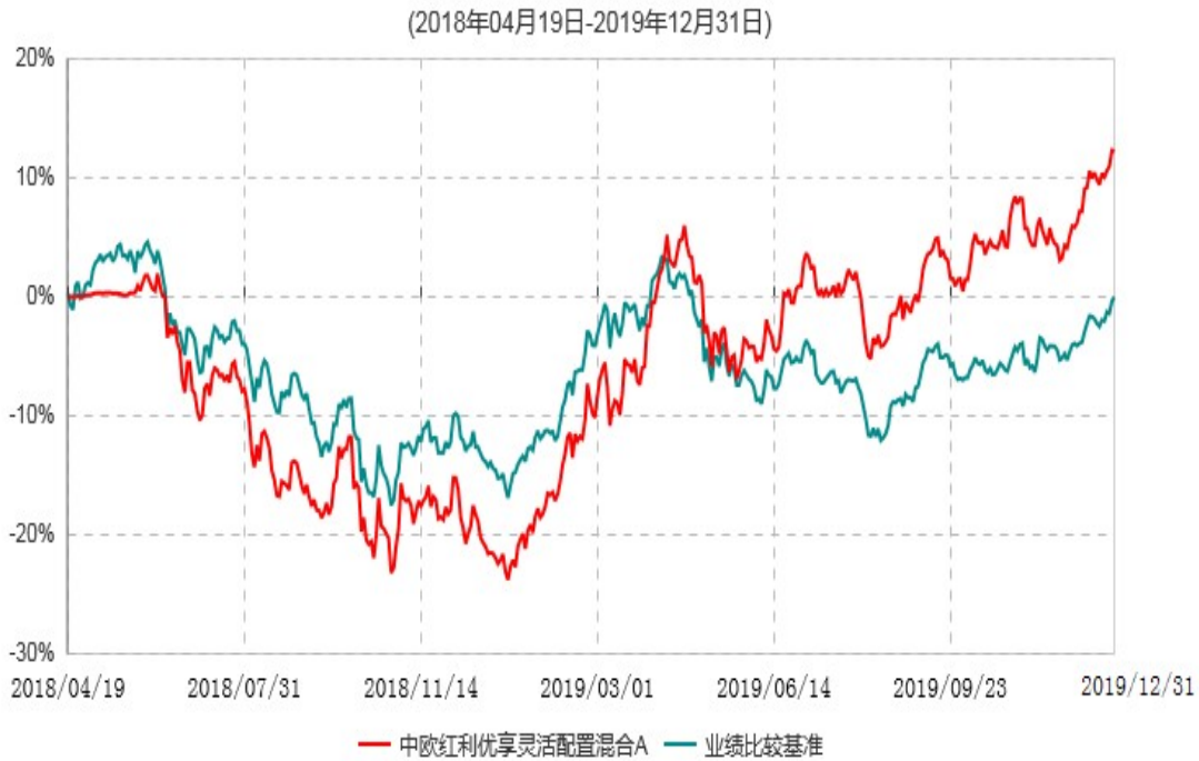
中欧红利优享灵活配置混合A累计净值增长率与业绩比较基准收益率历史走势对比图