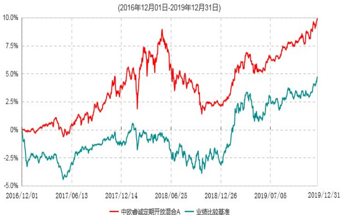
中欧睿诚定期开放混合A累计净值增长率与业绩比较基准收益率历史走势对比图